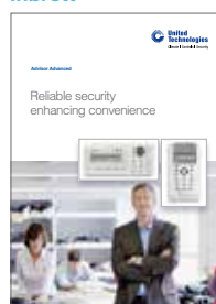
Advisor Advanced commercial brochure