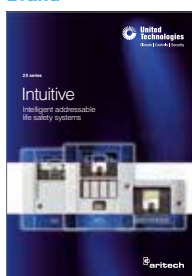
2X commercial brochure