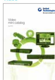
Video product range mini catalogue