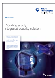
Advisor Master brochure