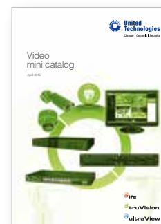
Video product range mini catalogue