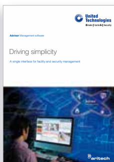
Advisor Management software brochure