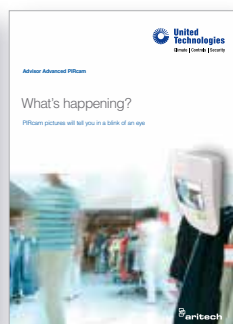
Advisor Advanced PIRcam brochure